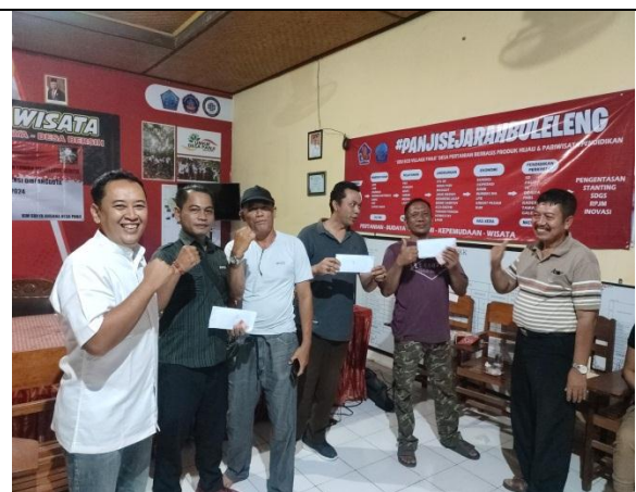
Foto-2. Penyerahan hadiah kepada sang juara