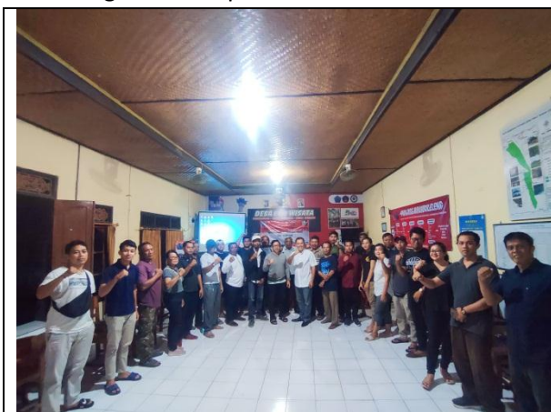
Foto-1. Foto bersama usai kegiatan